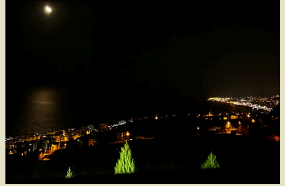
~Okul pansiyonumuzdan çekilmiştir.